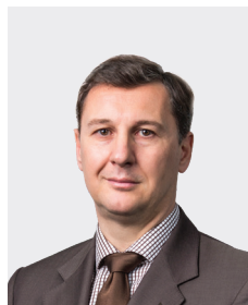
Henri Calvet អភិបាលឯករាជ្យ