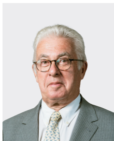
Guy Quaden អភិបាលឯករាជ្យ