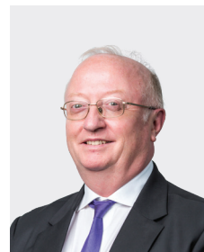
Etienne Chenevier អភិបាលឯករាជ្យ