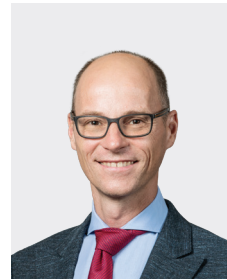
Lionel Pimpin អភិបាលមិនប្រតិបត្តិ