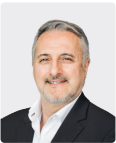
Paolo Pizzuto អភិបាលមិនប្រតិបត្តិ