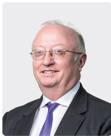
Etienne Chenevier អភិបាលឯករាជ្យ