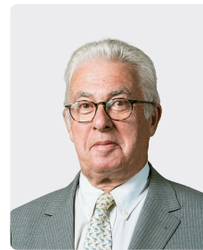
Guy Quaden អភិបាលឯករាជ្យ